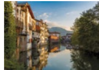
Escenario de la “Trilogía del Baztan”.

El pueblo más grande del Valle de Baztan, con sus palacetes y casas señoriales, refleja la riqueza que trajeron quienes emigraron a América. Destacan el palacio barroco de Arizkunenea , el ayuntamiento y la iglesia de Santiago .