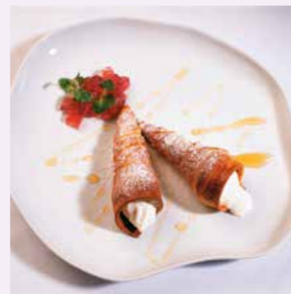
Canutillos de crema

La mesa pirenaica tiene sus propias especialidades: menús que utilizan como base la caza o los productos micológicos, las truchas, los sabrosos chuletones, la sidra, los quesos con Denominación de Origen Idiazabal, los postres lácteos como la tradicional cuajada o los canutillos de crema, las tortas de txantxigorri, frutas como el kiwi o exquisitos chocolates artesanales, como el urrakin eгина de Elizondo.