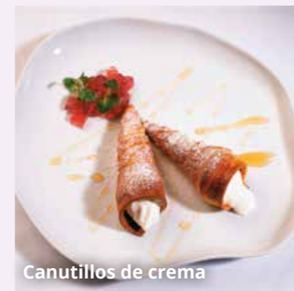
Canutillos de crema

La mesa pirenaica tiene sus propias especialidades: menús que utilizan como base la caza o los productos micológicos, las truchas, los sabrosos chuletones, la sidra, los quesos con Denominación de Origen Idiazabal, los postres lácteos como la tradicional cuajada o los canutillos de crema, las tortas de txantxigorri, frutas como el kiwi o exquisitos chocolates artesanales, como el urrakin eгина de Elizondo.