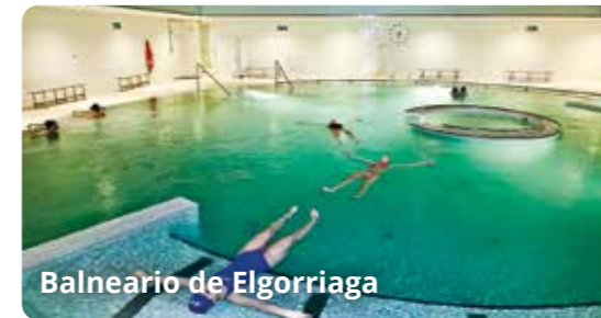
Balneario de Elgorriaga