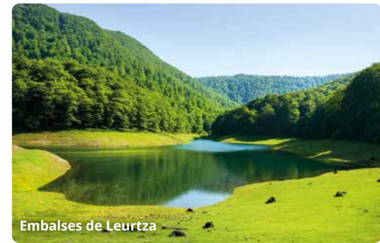
Embalses de Leurtza