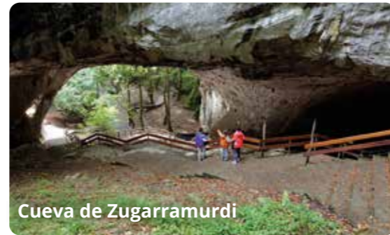
Cueva de Zugarramurdi