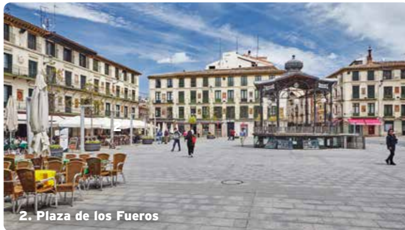
2. Plaza de los Fueros