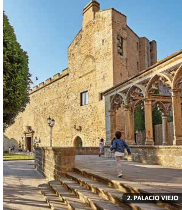
2. PALACIO VIEJO