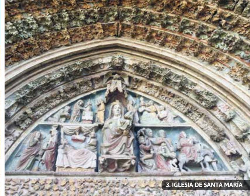
3. IGLESIA DE SANTA MARÍA