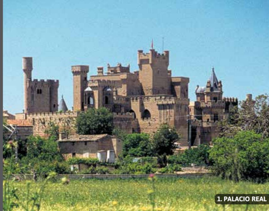
1. PALACIO REAL

A lo largo del año, existen otros encuentros festivos que invitan al visitante a acercarse a Olite. El sábado más próximo al 22 de mayo se celebra la romería a la ermita de Santa Brígida, en el monte Encinar. El domingo siguiente al 25 de abril, vecinos de Olite y de otros pueblos de la Zona Media participan en la romería de Ujué. El “Festival de Teatro Clásico de Olite” tiene lugar entre los meses de julio y agosto, en el que participan compañías de gran renombre. El día 26 de agosto se celebra la Virgen del Cólera, gran fiesta local. La fiesta de la Vendimia se realiza un domingo de la primera quincena de septiembre, con este evento la Cofradía del Vino de Navarra da comienzo a la campaña anual de recogida de la uva. Las fiestas patronales tienen lugar del 13 al 19 de septiembre.