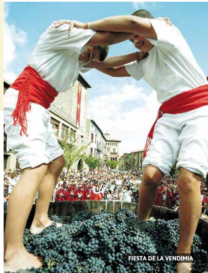
FIESTA DE LA VENDIMIA