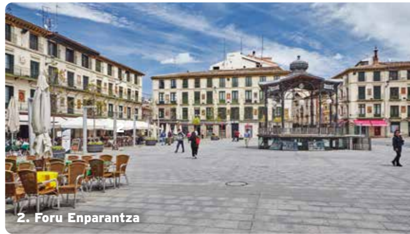
2. Foru Enparantza