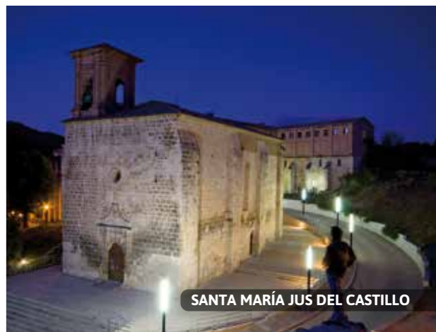
SANTA MARÍA JUS DEL CASTILLO