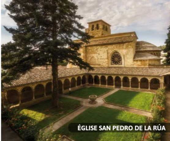
ÉGLISE SAN PEDRO DE LA RÚA