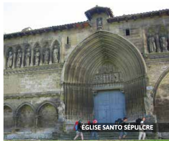
ÉGLISE SANTO SÉPULCRE