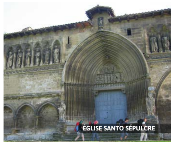
ÉGLISE SANTO SÉPULCRE