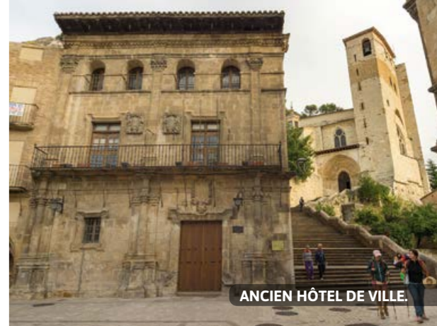
ANCIEN HÔTEL DE VILLE