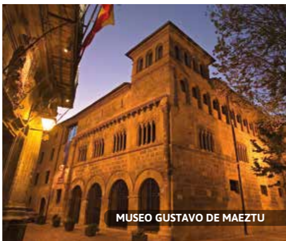
MUSEO GUSTAVO DE MAEZTU