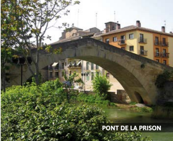
PONT DE LA PRISON

Mais quelle que soit l'époque de l'année, goûtez les succulents poivrons du piquillo ; ils se dégustent farcis de viande ou de poisson, seuls en accompagnement de viandes ou alors en salade comme entrée ; les champignons de à savourer avec des oeufs brouillés ou au four avec de l'ail ; l'agneau au chilindrón (agneau, poivrons rouges, ail et oignon) ; l'« ajoarriero » (morue avec une sauce de poivron, oignon, ail et tomate) ou encore les pochas (haricots blancs) en saison (de la fin août à octobre).