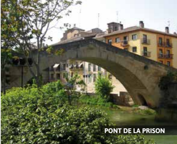
PONT DE LA PRISON

Mais quelle que soit l'époque de l'année, goûtez les succulents poivrons du piquillo ; ils se dégustent farcis de viande ou de poisson, seuls en accompagnement de viandes ou alors en salade comme entrée ; les champignons de à savourer avec des oeufs brouillés ou au four avec de l'ail ; l' agneau au chilindrón (agneau, poivrons rouges, ail et oignon) ; l'« ajorrero » (morue avec une sauce de poivron, oignon, ail et tomate) ou encore les pochas (haricots blancs) en saison (de la fin août à octobre).