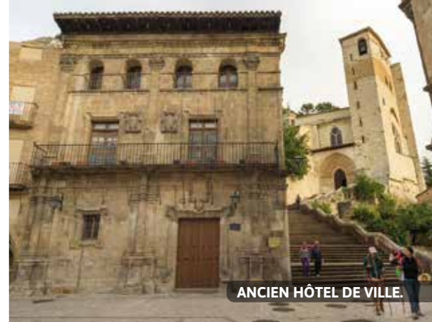
ANCIEN HÔTEL DE VILLE