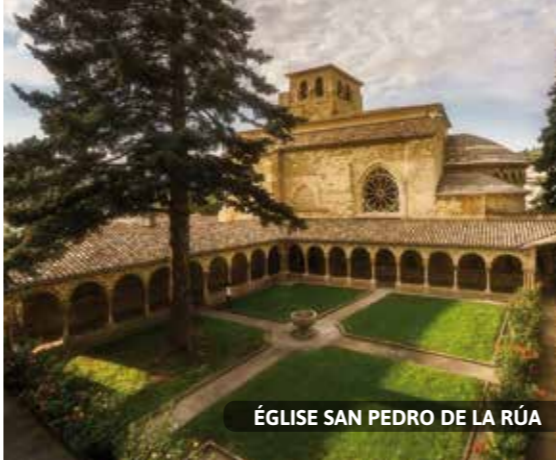
ÉGLISE SAN PEDRO DE LA RÚA