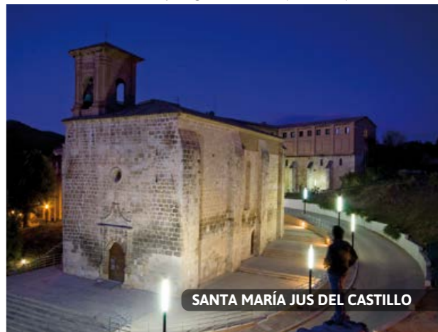
SANTA MARÍA JUS DEL CASTILLO