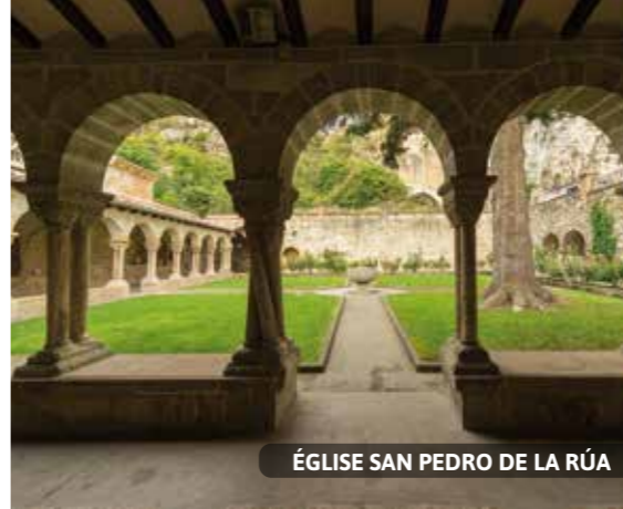
ÉGLISE SAN PEDRO DE LA RÚA