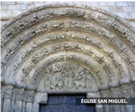
ÉGLISE SAN MIGUEL

20. SANTA MARÍA JUS DEL CASTILLO. C'est ici, dans le quartier d'Elgacena, que vivaient les premiers Juifs d'Estella-Lizarra. Troisième communauté par ordre d'importance du royaume de Navarre, derrière celles de Tudela et Pampelune, sa prospérité fut brutalement brisée, le 6 mars 1328. En 1145, la synagogue fut transformée en