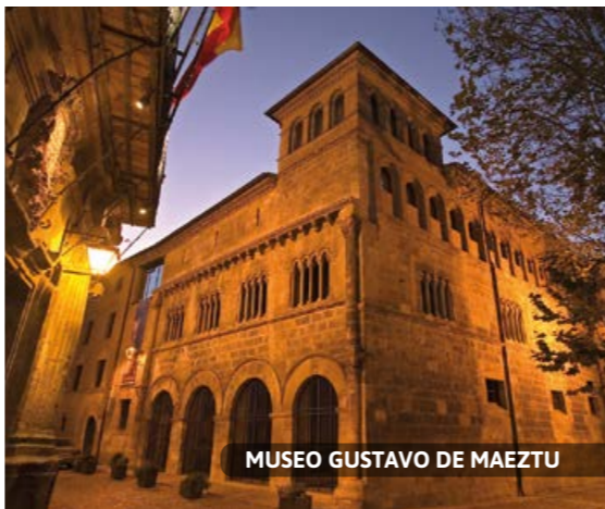
MUSEO GUSTAVO DE MAEZTU