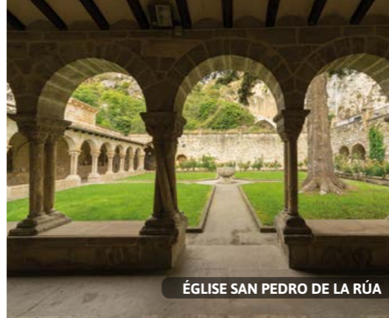
ÉGLISE SAN PEDRO DE LA RÚA