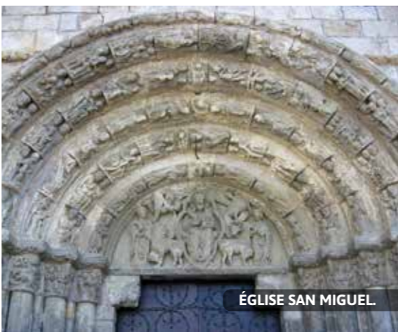
ÉGLISE SAN MIGUEL

20. SANTA MARÍA JUS DEL CASTILLO. C'est ici, dans le quartier d'Elgacena, que vivaient les Juifs d'Estella-Lizarrar. Troisième communauté par ordre d'importance du royaume de Navarre, derrière celles de Tudela et Pamplona, sa prospérité fut brutalement brisée, le 6 mars