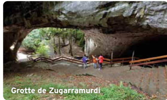
Grotte de Zugarramurdi