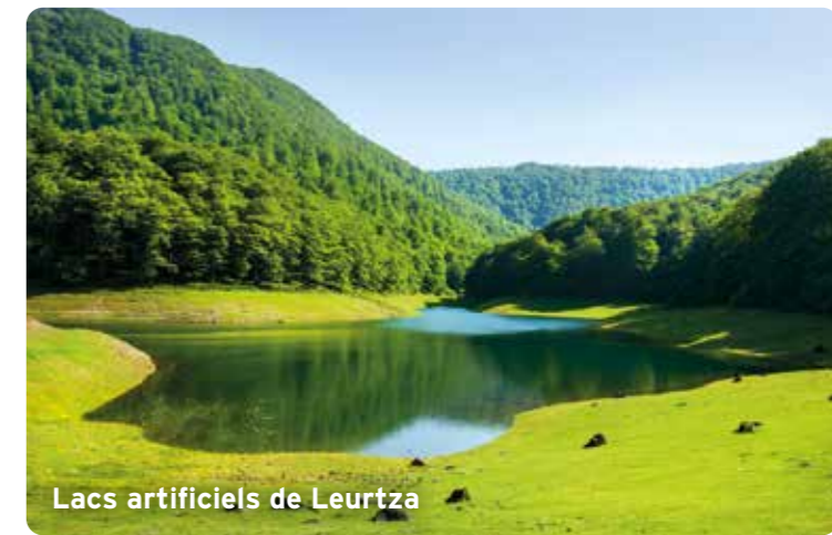
Lacs artificiels de Leurtza