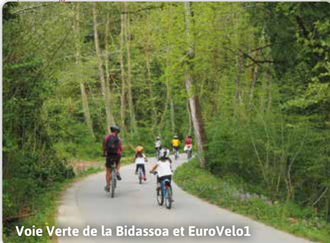
Voie Verte de la Bidassoa et EuroVelo1