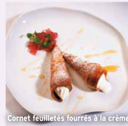
Cornet feuilletés fourrés à la crème

La table pyrénéenne dispose de ses propres spécialités : des menus élaborés à partir du gibier ou de la culture mycologique, les truites, les succulentes côtes de bœuf, le cidre, les fromages d'Appellation d'Origine Idiazabal, les desserts lactés comme la traditionnelle cuajada ou les canutillos de crema (cornet feuilletés fourrés à la crème), les gâteaux txantxigorri, des fruits comme le kiwi ou de délicieux chocolats artisanaux comme l'urrakin egina d'Elizondo.