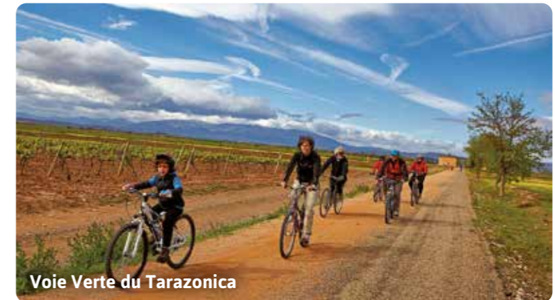
Voie Verte du Tarazonica