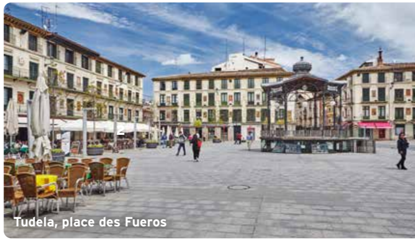
Tudela, place des Fueros