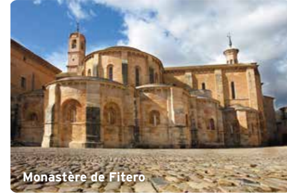
Monastère de Fitero