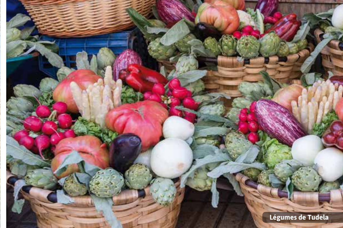
Légumes de Tudela