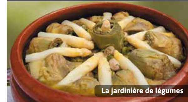
La jardinière de légumes

Les fêtes de Pâques à Tudela sont particulièrement importantes. De fait, la ville a conservé deux cérémonies traditionnelles, déclarées « Fêtes à Intérêt Touristique National » : el Volatín le Samedi Saint et la Bajada del Ángel (descente de l'Ange) le Dimanche de Pâques.