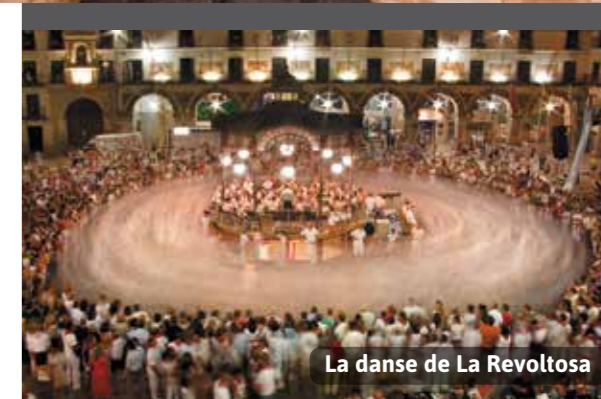
La danse de La Revoltosa

Tudela en fête : À la fin du mois de juillet ont lieu les fêtes patronales de Tudela en l'honneur de Santa Ana, sept jours durant : courses de taureaux dans les rues, corridas, défilé des Géants et Grosses têtes, concerts, feux d'artifice... et la danse de la Revoltosa autour du kiosque de la place des Fueros.