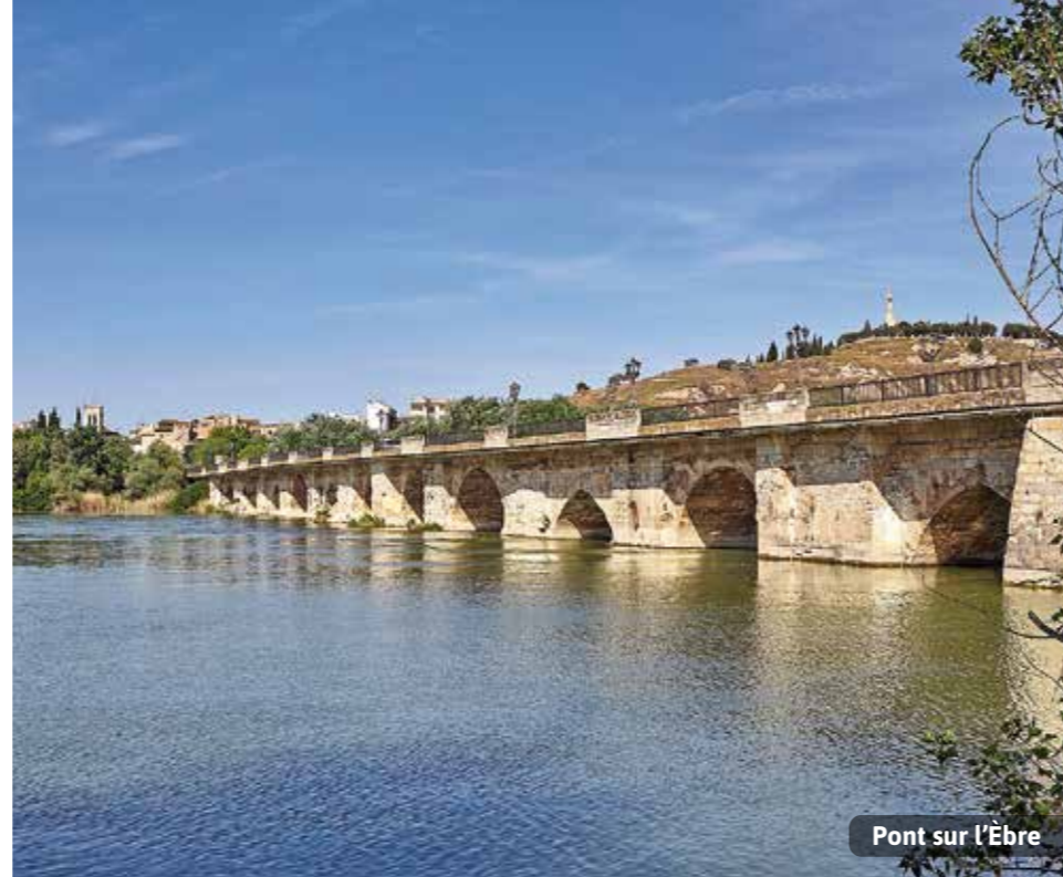
Pont sur l'Èbre