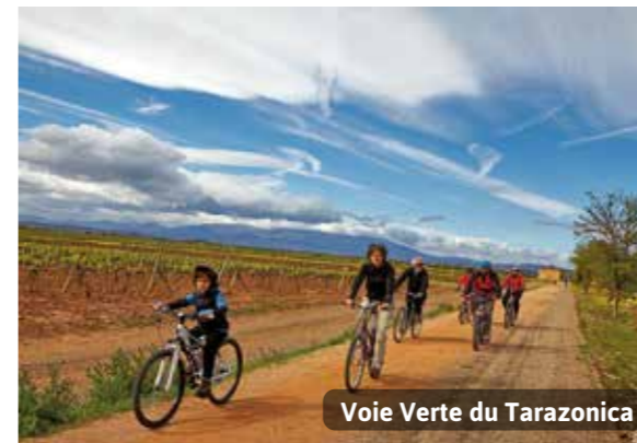
Voie Verte du Tarazonica

Judería Nueva : En 1170, le roi de Navarre Sanche VI le Sage ordonne de transférer le quartier juif sur un nouvel emplacement, à côté des murailles du château, dont il confie la garde et l'entretien aux habitants. Il semblerait que le nouveau quartier était disposé au tour de l'actuel Paseo del Castillo (promenade du château). L'augmentation progressive de la population au XIIIe et au XIVe entraînera l'agrandissement du quartier. Deux synagogues sont documentées : la Mayor et la Menor, mais nous ne savons pas où elles se trouvaient.