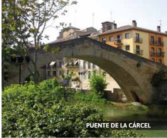
PUENTE DE LA CÁRCEL

En cualquier época del año se pueden elegir unos succulentos pimientos del piquillo ; se elaboran rellenos de carne o pescado, solos como acompañamiento de carnes o bien en ensalada como entrante. Revueltos de setas en temporada (de finales de septiembre a finales de noviembre). Hongos, también de temporada que se toman en revuelto o al horno al ajillo. Cordero al chilindrón (cordero, pimientos rojos, cebolla y ajo). El "ajoarriero" (bacalao desecado con pimiento, cebolla, ajo y tomate). Alubias pochas en temporada (finales de agosto a octubre).