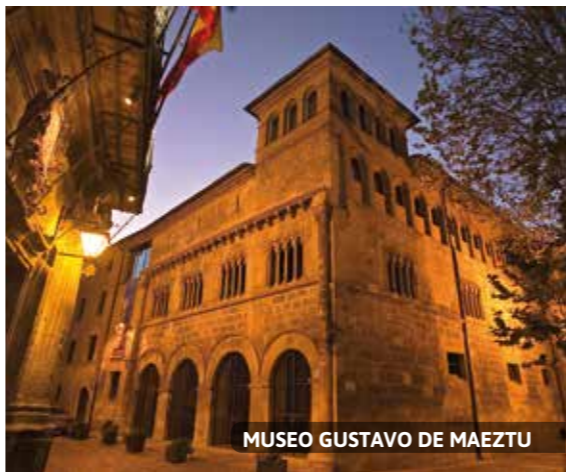
MUSEO GUSTAVO DE MAEZTU