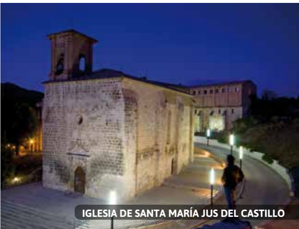
IGLESIA DE SANTA MARÍA JUS DEL CASTILLO