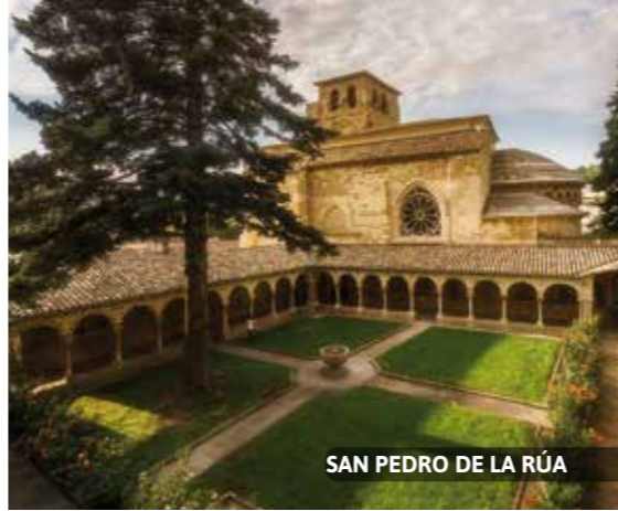
SAN PEDRO DE LA RÚA