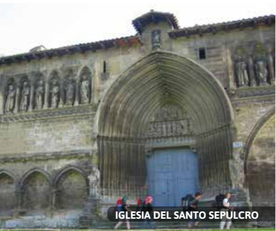
IGLESIA DEL SANTO SEPULCRO