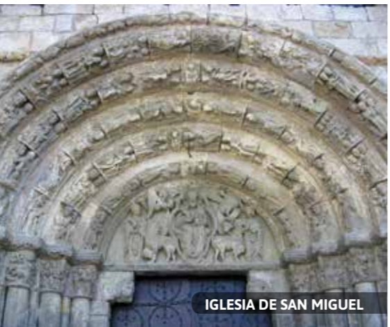
IGLESIA DE SAN MIGUEL

26. ESPACIO CULTURAL LOS LLANOS. Construido sobre el abandonado edificio que albergó el Convento de San Benito. En 1971 este edificio del siglo XVII fue abandonado por las benedictinas que se instalaron en otro de nueva planta construido en ladrillo rojo junto a la basílica del Puy. Actualmente alberga la escuela de música.