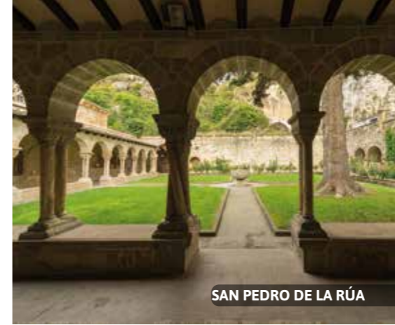
SAN PEDRO DE LA RÚA