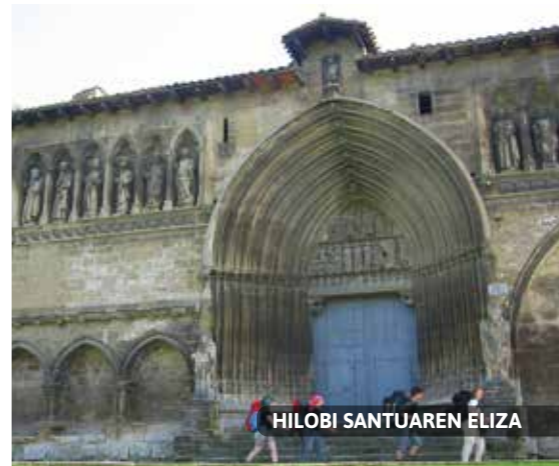
HILOBI SANTUAREN ELIZA