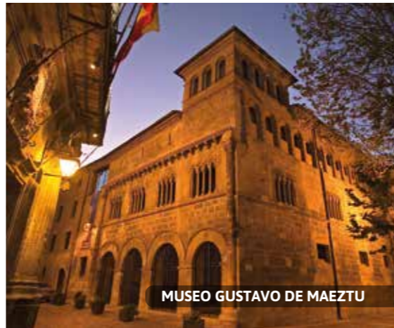
MUSEO GUSTAVO DE MAEZTU