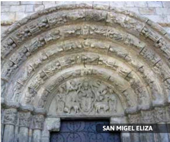
SAN MIGEL ELIZA

13. FORUEN PLAZA. Hiriko bilgunea da. Gaur egungo plaza Patxi Mangado arkitekto lizarrarrak eraiki zuen, xx. mendearen bukaeran. Ostegunetan, fruta- eta barazki-merkatua izaten da. Hileko 2. larunbata goizetan, bertako ekoizleen merkatua