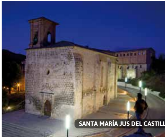
SANTA MARÍA JUS DEL CASTILLO

14. SAN JOAN BATAIATZAILEA ELIZA. Fatxada 1902an bukatu zuten, Anselmo de Vicuñaeren arkitekto lizarrarraren planoen arabera. Jatorrizko fatxada behera etorri zen, 1846an, erdiko gangarekin batera. Alboko ateez erakusten dute parrokia hori antzina-antzinakoa dela; hegoaldekoa gotikoa da, eta iparraldekoa, erromanikoa. Barruan, xvi. mendearen hasierako erretaula erromanista bat dago. Gurutze gotiko bat ere badago, epistolaren nabearen oinean.